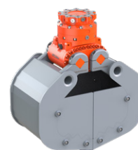
En option: panneaux latéraux vissés

Extension de garantie gratuite kinshofer.com/service