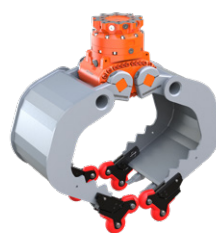
En option: 4-Grip